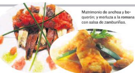
Matrimonio de anchoa y boquerón; y merluza a la romana con salsa de zamburiñas.

Destacan unas cremosas croquetas de jamón, también son posibles los callos a la madrileña, el salmorejo ibérico y huevo de codorniz o un saltado de judías verdes y langos-